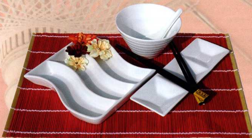
Geschirr aus Fernost bringt Asia-Feeling auf den Tisch.

Grundsätzlich muss gentechnisch veränderte Soja in der Zutatenliste gekennzeichnet sein. Das heißt, der Kunde erkennt diesen Einsatz immer auf dem Etikett. Allerdings wird für die menschliche Ernährung in Deutschland auf die Verarbeitung nicht gentechnisch veränderter Soja geachtet.